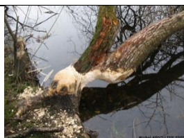
Le travail des castors